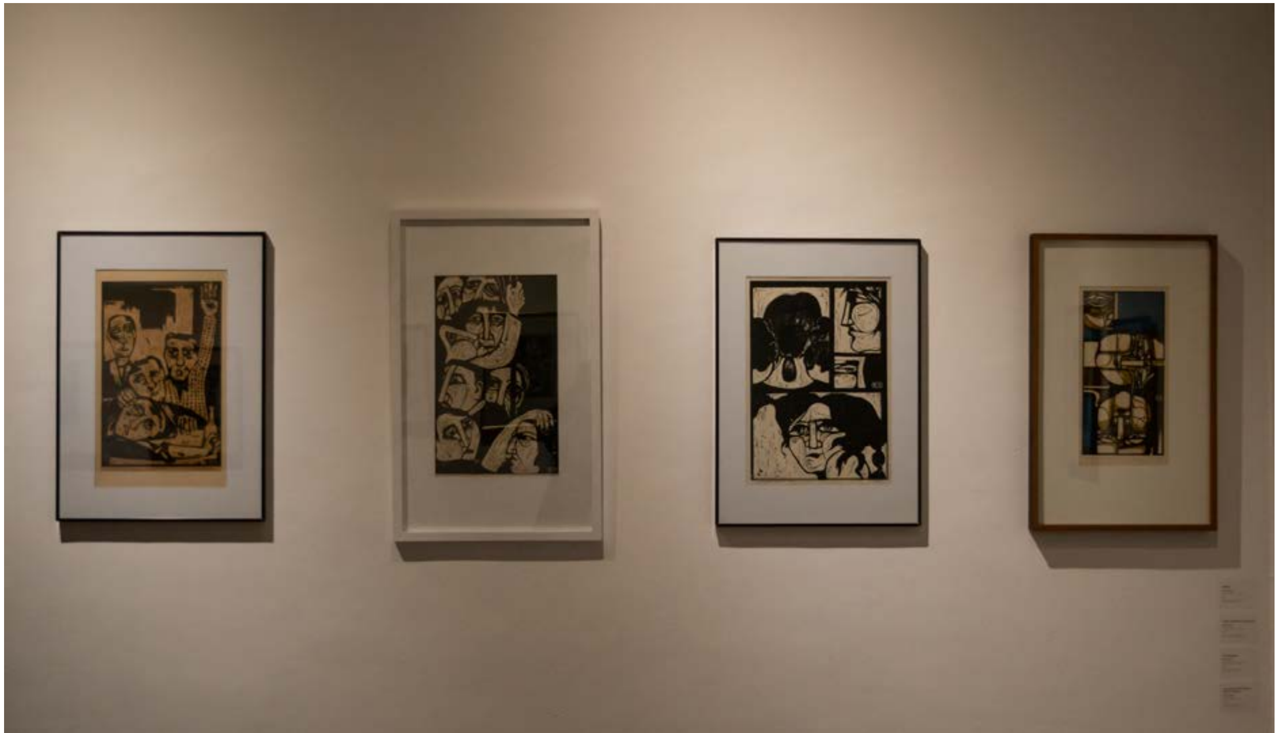
Fotografías de sala tomadas por Aimé Luna