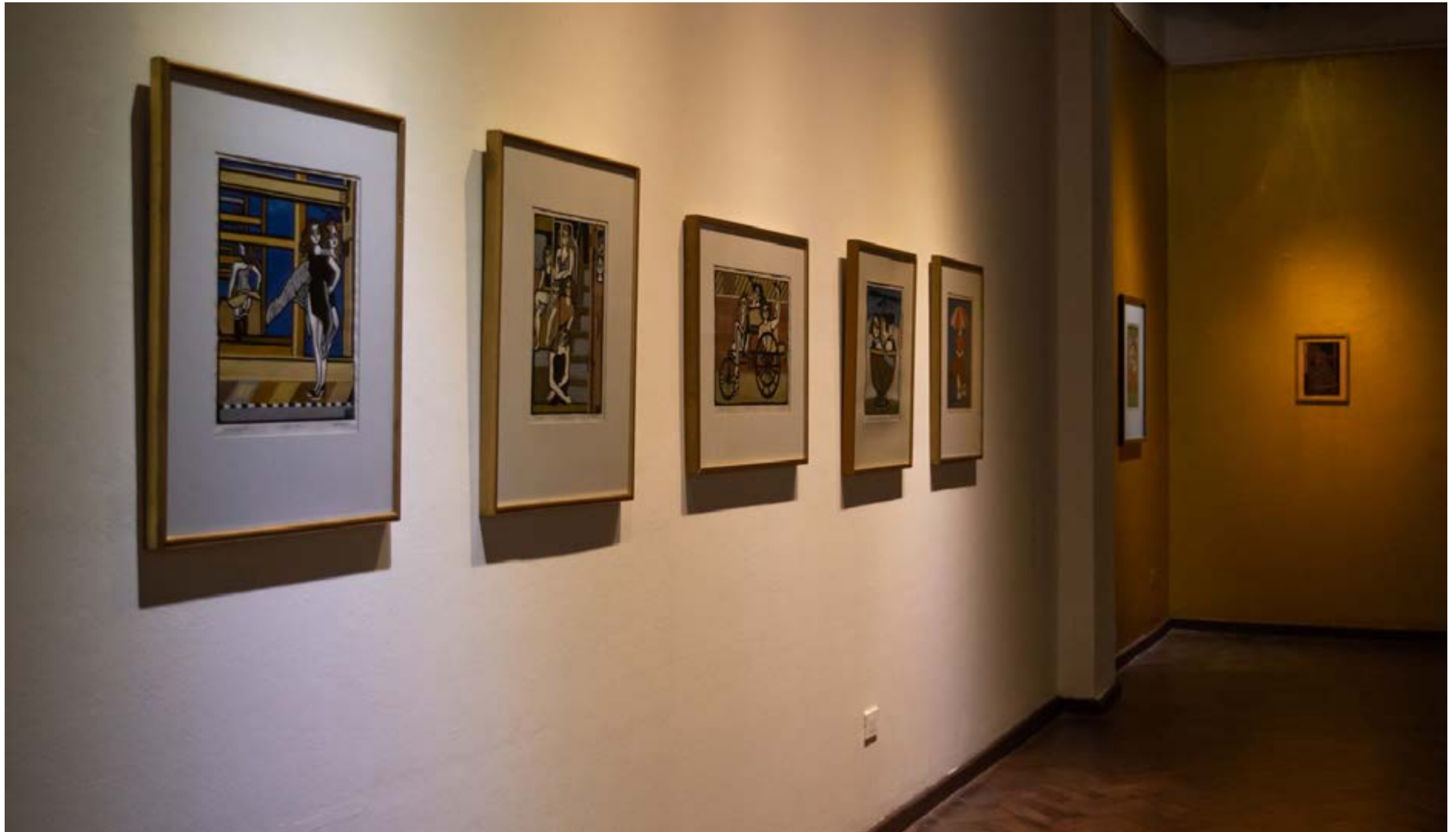
Fotografías de sala